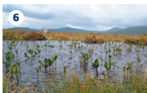
6 RSPB FORSINARD RESERVE Riserva naturale della società britannica per la protezione degli uccelli. Ideale per conoscere l'avifauna e la flora del Flow Country. Esposizioni di flora e fauna ed escursioni guidate. Centro visitatori.