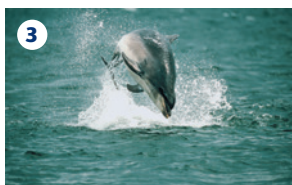
3 GAIRLOCH MARINE LIFE CENTRE ED ESCURSIONI IN MARE 'SAIL GAIRLOCH' Escursioni in barca durante le quali è possibile osservare balenottere rostrate, delfini, focine e foche. Centro visitatori.