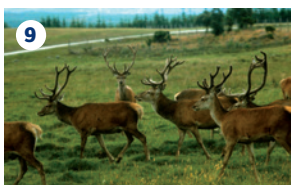
9 HIGHLAND WILDLIFE PARK, KINGUSSIE In questo parco faunistico potrete scoprire passato e presente della fauna scozzese ed esplorare a piedi degli habitat tematici. La riserva principale del centro ospita lupi, gatti selvatici, bisonti, castori, linci, galli cedroni e molti altri animali.