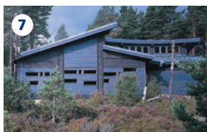
7 LOCH GARTEN OSPREY CENTRE Centro che d'estate offre la possibilità di vedere da vicino, per mezzo di una tv a circuito chiuso, i falchi pescatori che nidificano. Potrete anche conoscere gli altri uccelli che vivono nelle foreste di pini indigeni.