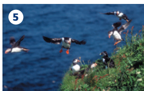
5 ISOLA DI HANDA – Isola in mare aperto con scogliere. Ospita una delle più popolose colonie di uccelli marini dell'Europa nordoccidentale. Il traghetto (da Tarbert) effettua servizio da aprile a settembre.