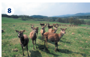
8 TENUTA DI ROTHIEMURCHUS Escursioni guidate, safari tour e tante altre attività all'aria aperta nel cuore del parco nazionale dei monti Cairngorm.