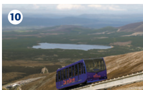
10 FUNICOLARE DEI MONTI CAIRNGORM Linea di montagna funzionante tutto l'anno, arrivando a 150 metri sotto la cima delle montagne Cairngorm. La più alta e più veloce del Regno Unito. Negozio, ristorante ed esposizioni relative alle montagne.