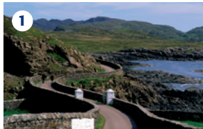
1 ARDNAMURCHAN POINT VISITOR CENTRE Il centro di informazioni della punta di Ardnamurchan, situato in un faro che si trova nel punto più a ovest delle coste della Gran Bretagna, è circondato da un paesaggio spettacolare che offre panorami fantastici delle Ebridi e delle Small Isles, e da qui si possono anche osservare le balene.

Il paesaggio delle Highlands, selvaggio e incontaminato, offre agli animali selvatici una serie di habitat diversi, dai mari pescosi, ambiente ideale per le balene e i delfini, ai monti rocciosi e alle brughiere, territori propri delle aquile reali. Le probabilità di avvistare per caso una foca o una lontra, un cervo o uno scoiattolo rosso, un'aquila o una albanella reale – o qualsiasi altra specie animale caratteristica delle Highlands – sono abbastanza alte, tuttavia questo itinerario vi porterà in alcune località tra le migliori della Scozia per osservare gli animali selvatici, molte delle quali sono riserve naturali.