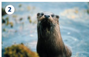
2 KYLERHEA OTTER HAVEN Un rifugio per le lontre. La postazione per osservarle domina gli stretti Kylerhea Narrows, tra l'isola di Skye e la costa. Questo è un habitat ideale per le lontre, con lontre selvatiche residenti.