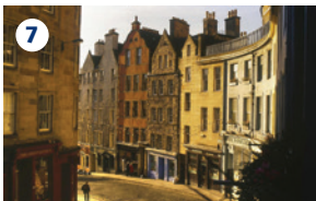
7 EDMBURGO, CITTÀ DELLA LETTERATURA Esplorare la prima città ad avere ricevuto il titolo di città della letteratura dall'UNESCO visitando il museo degli scrittori ( Writers' Museum ), il centro del teatro di narrazione ( Scottish Storytelling Centre ) oppure una delle tante librerie cittadine.