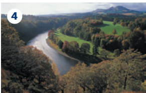
4 SCOTT'S VIEW – Famoso punto panoramico lungo la B6356. È la vista che sir Walter Scott amava più di ogni altra, sul fiume Tweed e i monti Eildon.