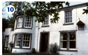
10 LA CASA NATALE DI JAMES MATTHEW BARRIE – Il creatore di Peter Pan, James Matthew Barrie, ebbe umili origini: suo padre era un tessitore su telaio a mano. Il suo racconto di folletti, di cocodilli e di un ragazzo che non cresce mai fu pubblicato nel 1904.