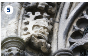
5 LA CAPPELLA ROSSLYN – Questa cappella rappresenta il più bell'esempio in Scozia di scultura tardo medievale. La straordinaria mescolanza di temi e di simboli religiosi e pagani ha un ruolo importante nella trama del romanzo bestseller di Dan Brown Il codice da Vinci .