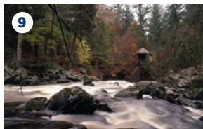
9 THE HERMITAGE – Un'affascinante passeggiata nei boschi dove sorgono due edifici stravaganti, l' Ossian's Hall e l' Ossian's Cave fatti costruire dal duca di Atholl nello spirito delle opere di James MacPherson.