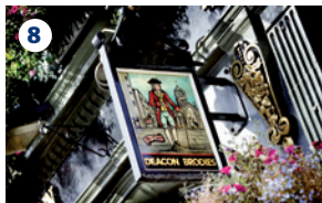
8 GIRI LETTERARI DI EDMBURGO Girate piacevolmente nelle stradine, nei cortili e nei pub di Edimburgo alla scoperta dei maggiori scrittori scozzesi. Sono disponibili anche visite specializzate su bestseller Rebus di Ian Rankin e su Trainspotting di Irvine Welsh.