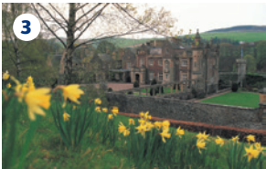
3 ABBOTSFORD – Questa fu la dimora, fatta costruire da lui stesso, di sir Walter Scott, il famoso scrittore scozzese dell'Ottocento. I visitatori possono vedere il suo studio, la biblioteca, il salotto, l'atrio e le armerie.