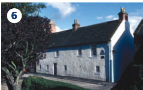
6 SWANSTON – Robert Louis Stevenson conosceva fin da ragazzo il piccolo agglomerato di Swanson, ai limiti della città, che figura nel suo romanzo St Ives , in cui un prigioniero francese, Monsieur de St Yves, evade dal castello di Edimburgo.