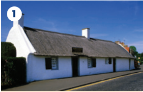
1 LA STRADA DI ROBERT BURNS Un itinerario segnalato che tocca tutti i luoghi legati a Robert Burns, da quello natale di Alloway, presso Ayr, fino a Dumfries, dove trascorse gli ultimi anni della sua vita.

Un viaggio attraverso la Scozia può rivelare molti legami con la letteratura: dai classici scozzesi come sir Walter Scott e Robert Louis Stevenson agli autori moderni di successo come JK Rowling, che si possono incontrare sia nella vita elegante della New Town di Edimburgo che nei paesaggi suggestivi della regione dei Borders.